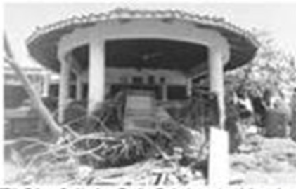
"Piña Palmera", ubicado en Zipolite, Pochutla, requiere de la ayuda y solidaridad de la sociedad.

El Centro de Rehabilitación para Personas con Discapacidad atraviesa por un duro momento, con graves afectaciones en su inmueble y la pérdida de equipamiento