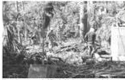
Hasta el momento, sólo el Ejército Mexicano les ha ayudado con labores de limpieza.

do la continuación del trabajo que realizan desde hace más de tres décadas en apoyo a las Personas con Discapacidad de la Costa y Sierra Sur.